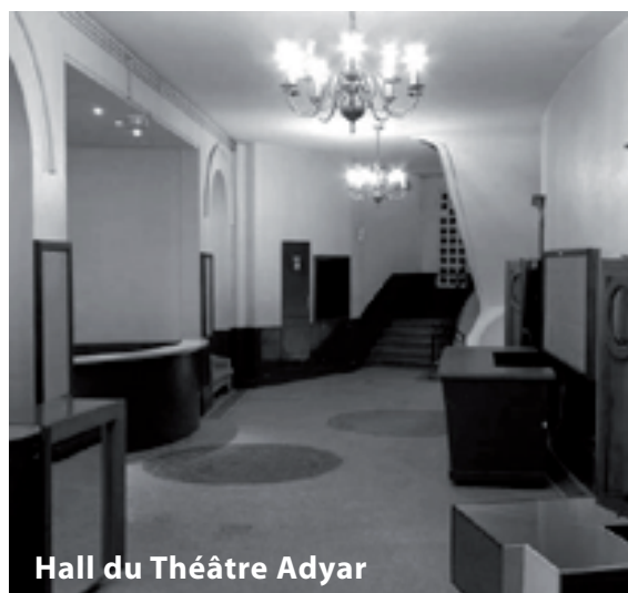
Hall du Théâtre Adyar